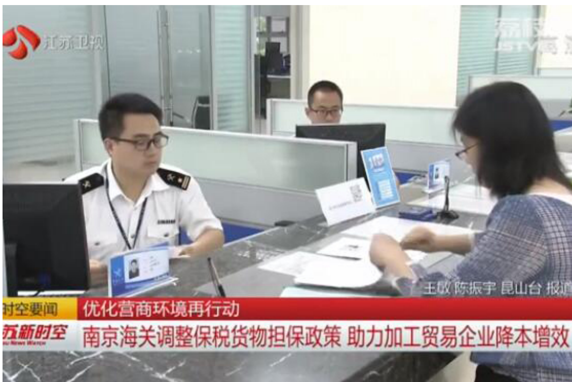
南京海关调整保税货物担保政策