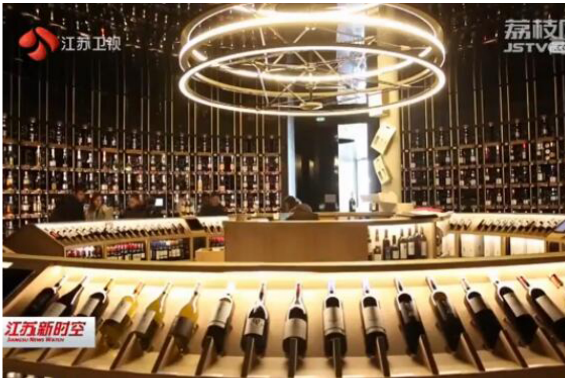
宁夏贺兰山东麓葡萄酒来宁推介