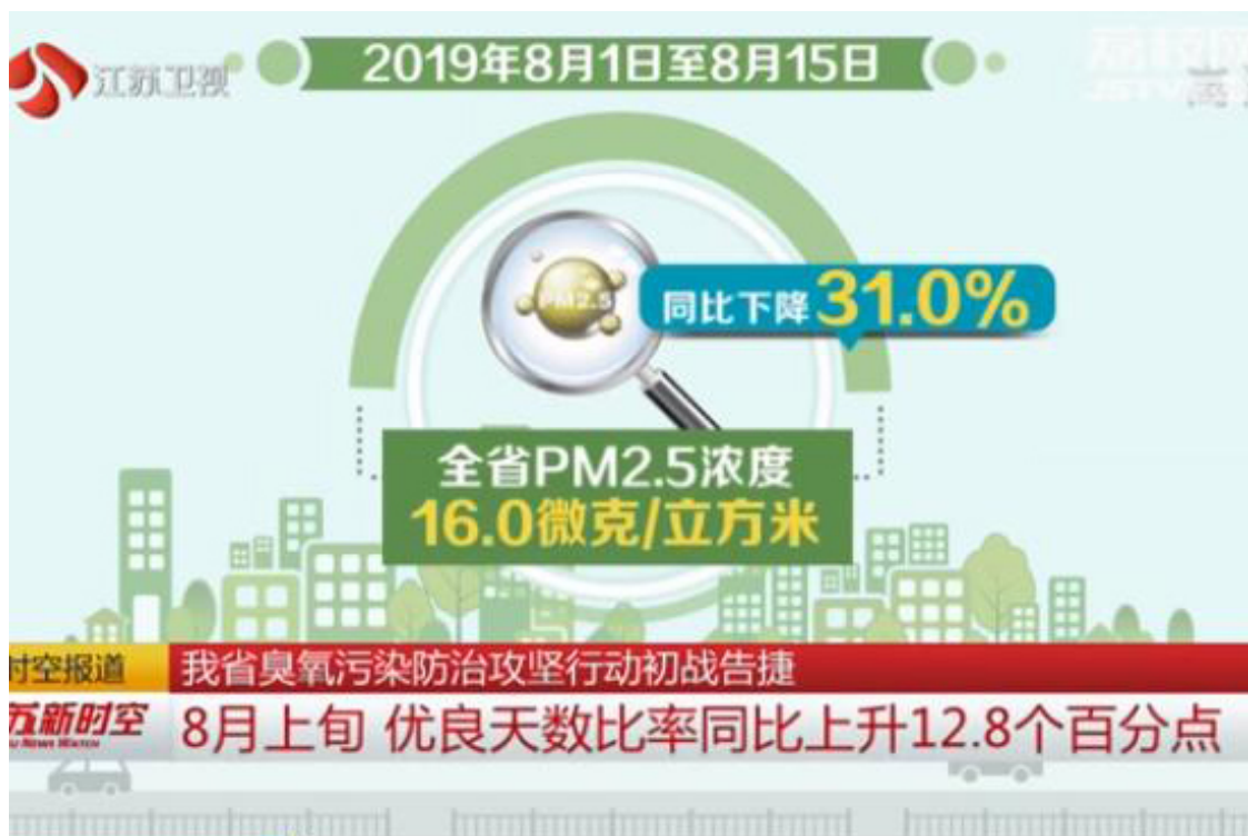
江苏省臭氧污染防治攻坚行动初战告捷

中国共产党新闻网 | 中国共产党历史网 | 共产党员网 | 江苏党史网 | 江苏机关党建网 | 江苏先锋网